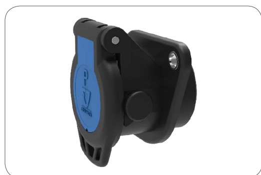
Socle de parc EXPERT EXPERT parking socket