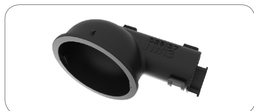
Raccord pour gaine annelée 90° (rotation libre à 360°) 90° corrugated tube outlet (freely rotated by 360°)