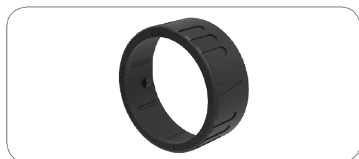
Verrouillage à baïonnette pour raccords sur gaine annelée bayonett ring for corrugated tube outlet