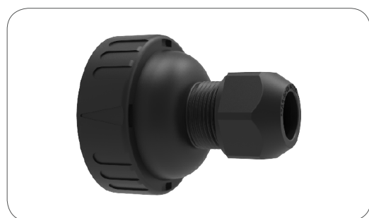
Sortie à baïonnette pour connexion sur câbles de diamètre: Bayonet cap for cable with diameter: